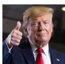
REPUBLICANO DONALD TRUMP