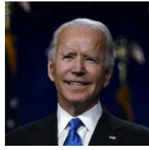
DEMÓCRATA JOE BIDEN