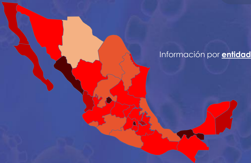
Información por entidad